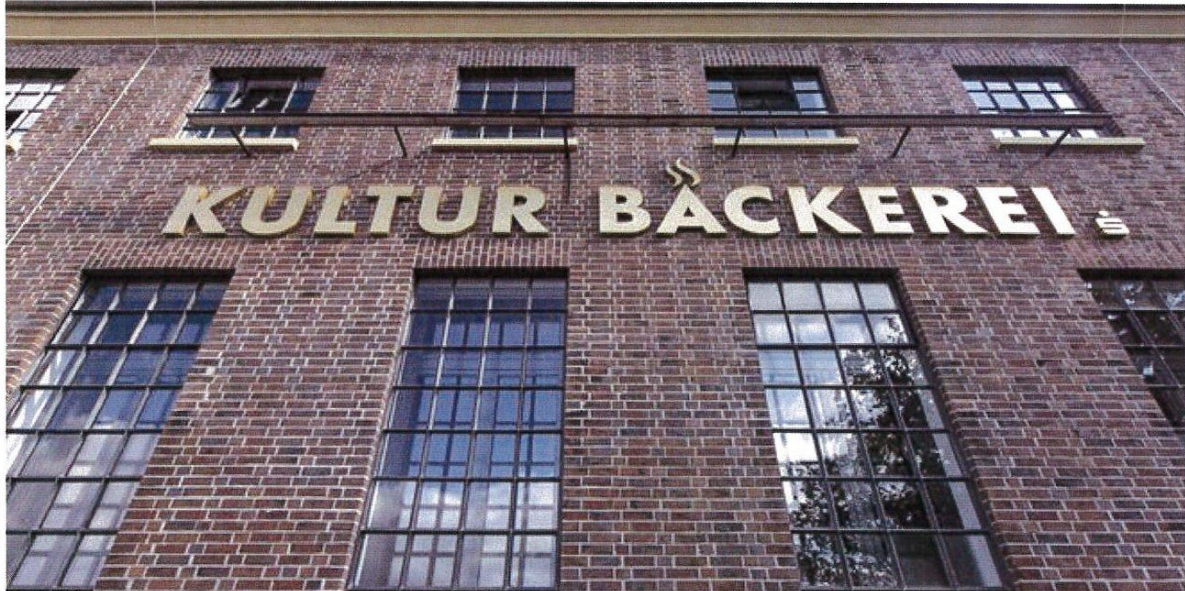
Die Sparkassenstiftung Lüneburg kann sich über den Sonderpreis für die KulturBäckerei freuen.