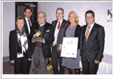
Remmers erhält den KulturKontakte-Preis 2016

(pressebox) (Löningen, 07.12.2016) Die Remmers Gruppe AG hat nicht nur in Form der vielen Baudenkmäler, die mit ihren Produkten restauriert werden, mit dem Thema Kultur zu tun. Denn darüber hinaus engagiert sich das Unternehmen für das kulturelle Erbe seiner Heimatstadt Löningen. So unterstützt Remmers seit knapp 20 Jahren die Kinotechnische Sammlung Dr. Heinz Dobelmann e.V. - und das nicht nur finanziell, sondern auch personell und logistisch.